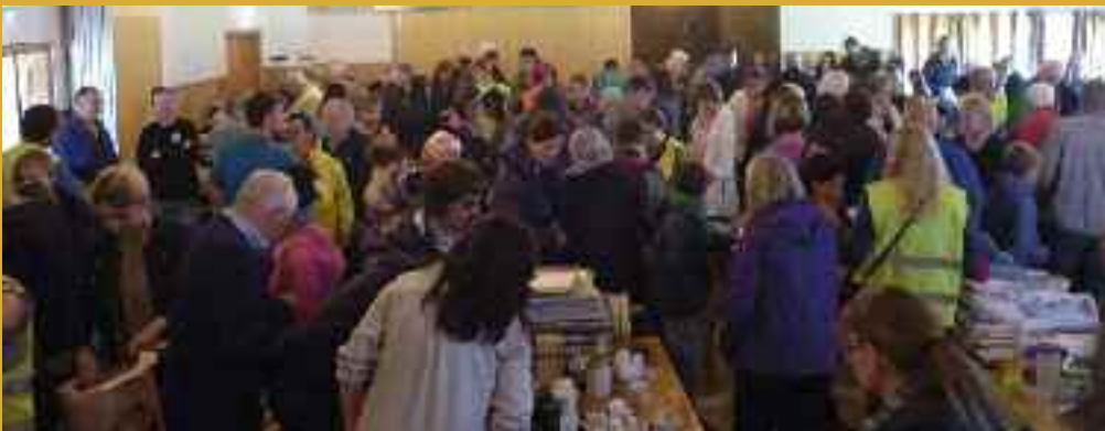
Hovedsalen ble raskt fylt opp av kjøpere da dørene åpnet.